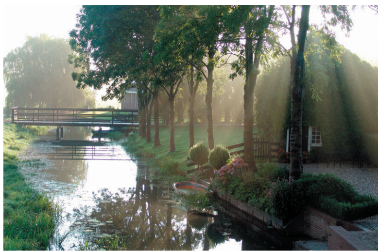
De winnende foto van dit jaar, gemaakt door Marco Savelkouls.

Tijdens de goed bezochte prijsuitreiking in het FulcoTheater vertelde winnaar Savelkouls vol enthousiasme over hoe en waar hij zijn foto heeft gemaakt. "Op een vroege morgen, eind augustus 2004, keek ik naar buiten en bedacht me geen moment. Vlug aangekleed, snel mijn net aangeschafte digitale camera gepakt, op de fiets gesprongen en richting de Lage Dijk Zuid gereden. Het landschap zag er op dat moment