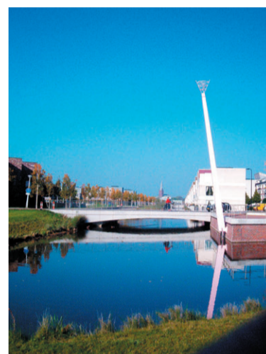
Deze foto van Theo Molier won de 'Onze IJsselstreek Publieksprijs'.

uit Nieuwegein naar huis met een weekend lang rijden in een auto naar keuze van de Terberg Autobedrijven. Hij behaalde zelf de tiende plaats met de foto 'De kerk van Cabauw'.