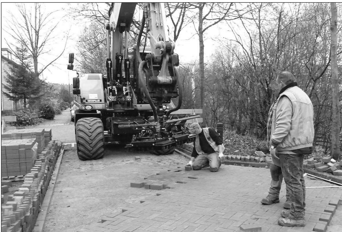
Machinaal straten aan de Prins Willem Alexanderdijk.