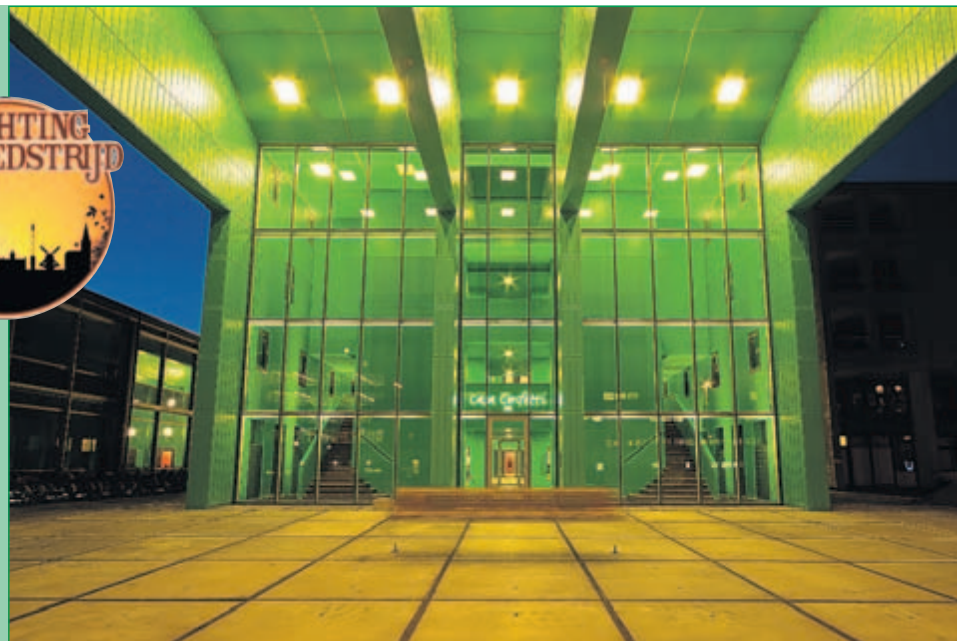
Casa Confetti, Utrecht: Een studie nachtfotografie in 2009. Overdag valt het gebouw - studen- tenhuisvesting op de Uithof - op door de kleurige gevelpanelen en 's avonds door de gifgroene verlichting van de entree. Een scherp beeld om dwars door het gebouw te kijken.