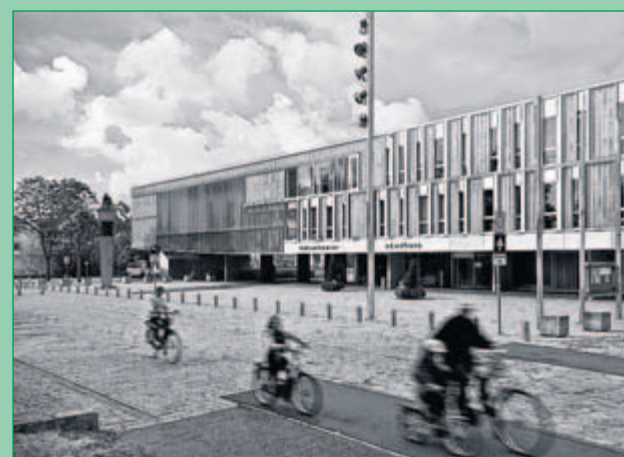
Stadhuis IJsselstein: Uit 2007, ter gelegenheid van Open Monumentendag: architectuur van de 20e eeuw. Een bewuste keus voor zwart-wit, voor tijdloos klassiek en een abstractie van de werkelijkheid. De onscherpe fietsers zorgen voor diepte en de menselijke maat.