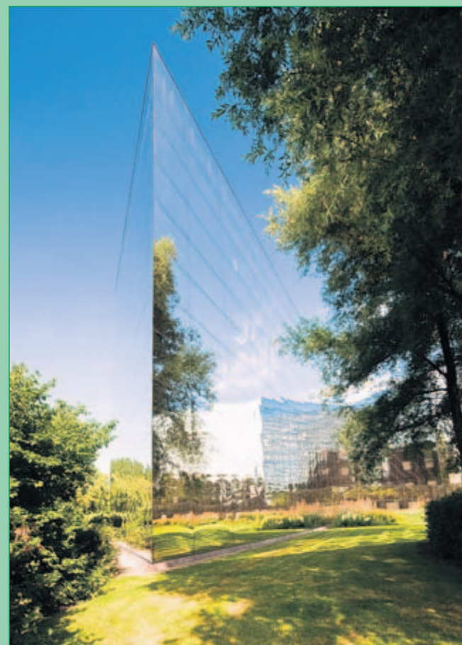
Gebouw Allianz, Nieuwegein: Zomer 2009, het gebouw van verzekeringsmaatschappij Allianz in Nieuwegein. Het gebouw spiegelt op een bijzondere manier het groen dat er omheen staat.