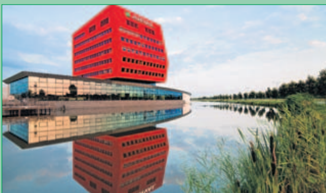
Gebouw Arval, Houten: Een mooie windstille avond in de zomer van 2009. Een bijzonder gebouw met een felrode kleur en aparte vorm. Behalve de mooie spiegeling lijkt de bomenrij kleiner te worden en te verdwijnen in de verte.