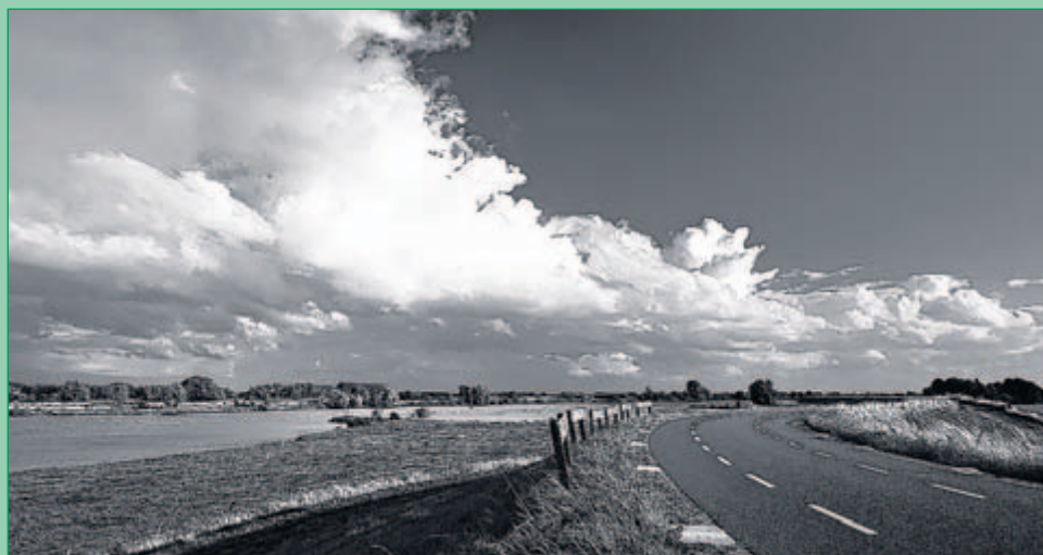
Lekdijk IJsselstein: Gemaakt op een druilerige zondagmiddag in 2009, als resultaat van een fietstochtje. Deze foto is in zwart-wit sprekender dan in kleur: de wolken, de weg en de Lek; alles lijkt rechtsom te draaien.

Wie de kunst wil afkijken kan in het najaar bij Verbruggen terecht voor een beginnerscursus bij het Kursusproject. "Het is leuk om kennis en ervaring over te dragen." Voor meer informatie: www.jvfotografie.com of info@jvfotografie.com